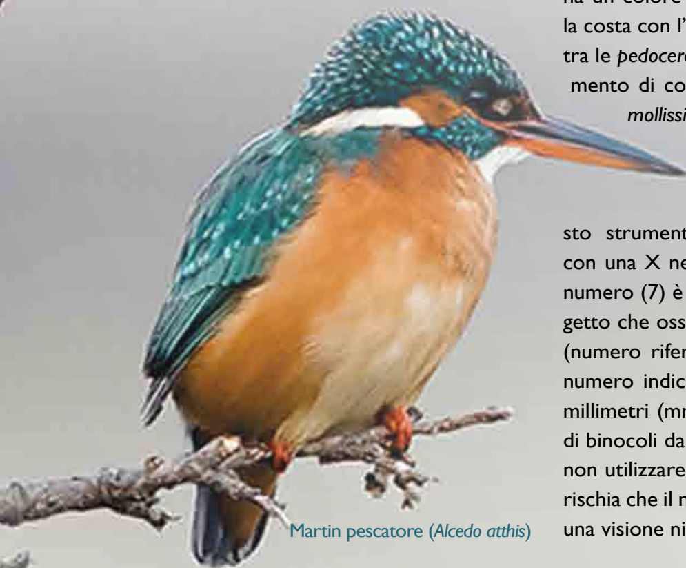
Martin pescatore ( Alcedo atthis )