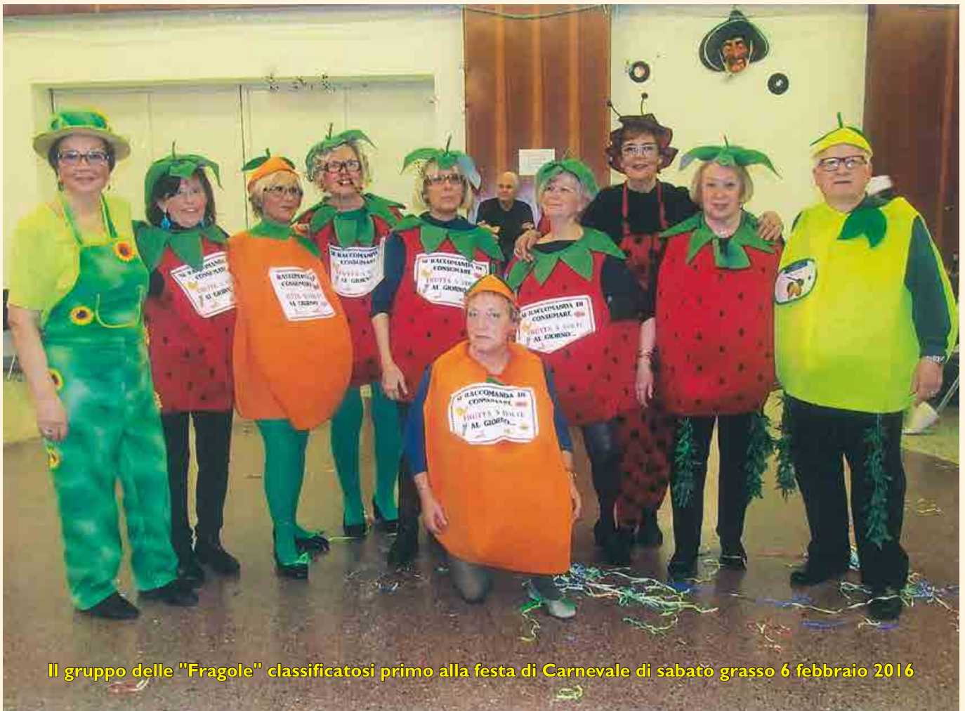
Il gruppo delle "Fragole" classificatosi primo alla festa di Carnevale di sabato grasso 6 febbraio 2016

Una giuria ha decretato a chi assegnare i vari premi messi in palio per le maschere più significative. Un premio se l'è aggiudicato la coppia più simpatica, ma chi ha avuto l'onore di piazzarsi primo è stato il gruppo delle "Fragole", che sui bei costumi indossati, come possiamo vedere nella fotografia, ha esibito la scritta "si raccomanda di consumare frutta cinque volte al giorno", un bel messaggio rivolto a tutti coloro che sapranno coglierlo per stare meglio in salute. Ha vinto dunque l'intelligenza abbinata alla fantasia. Bravissimi tutti.