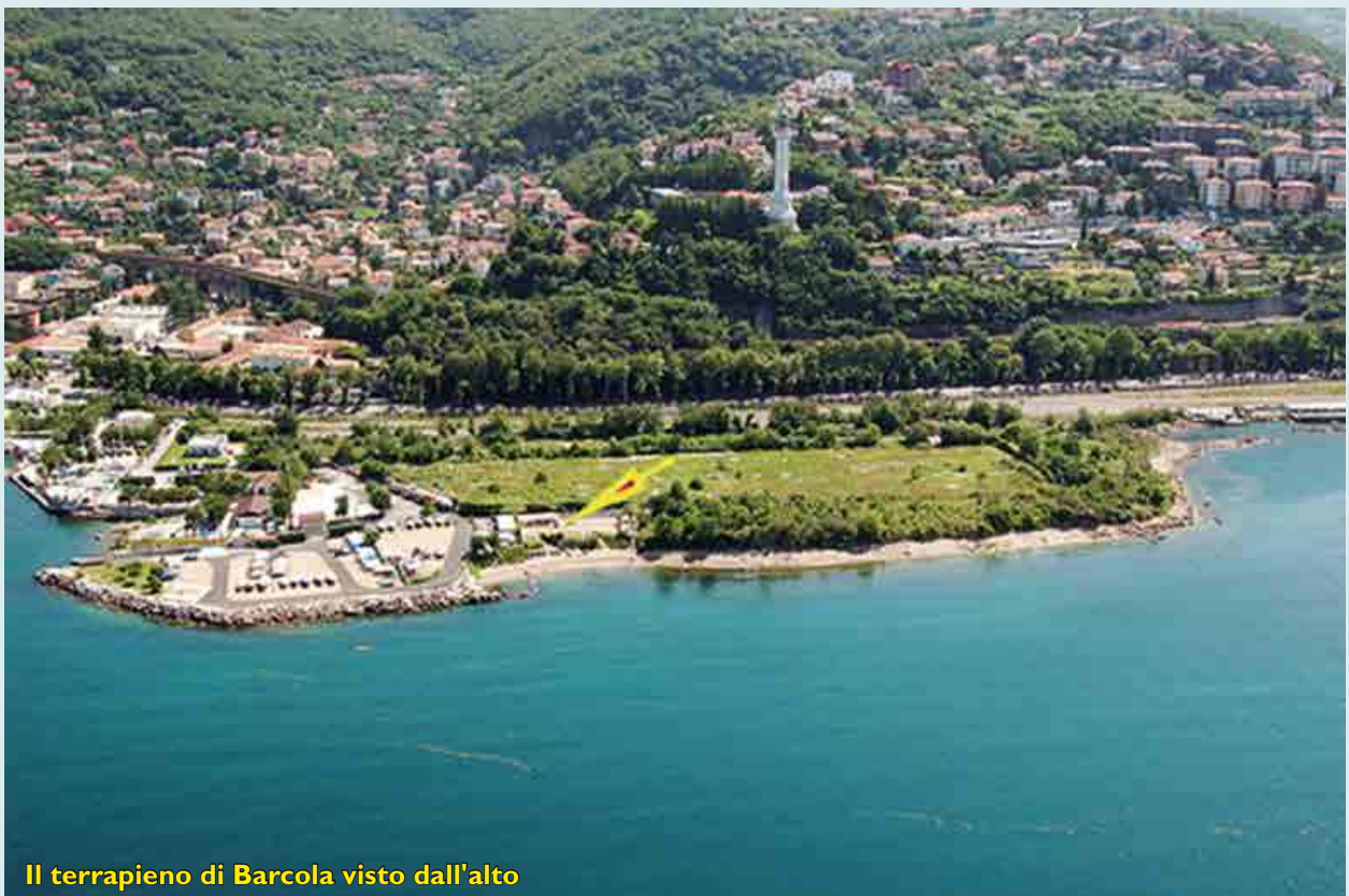
Il terrapieno di Barcola visto dall'alto