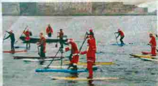
L'arrivo dei Babbi Natale sulle tavole da SUP

I Babbi Natale arrivano sulle Rive a colpi di pagaia