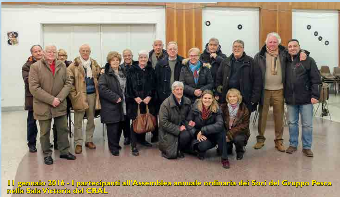
Il gennaio 2016 - I partecipanti all'Assemblea annuale ordinaria dei Soci del Gruppo Pesca nella Sala Victoria del CRAL